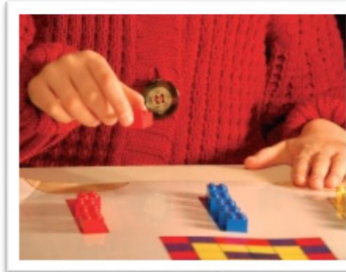
Überkreuzungstest der Körpermitte