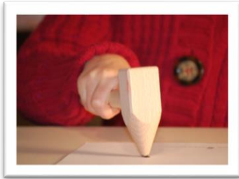
Hämmertest als ungeschulte Leistung

Theoretische, wissenschaftliche und forschungsbasierte Information zur Händigkeitstestung mit kritischer Diskussion. Bezug zu Fallbeispielen in der Praxis. Input zur Behandlung und Therapie von unterschiedlichen händigkeitsauffälligen Kindern.